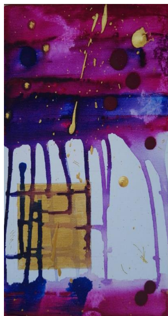
作品 # 5 3 (21cm × 17cm)

期間 2017年10月16日（月） ～ 2017年10月20日（金） 10:00am ～ 1:00pm 2:00pm ～ 5:00pm 会場 在日ルーマニア大使館 東京都港区西麻布3-16-19